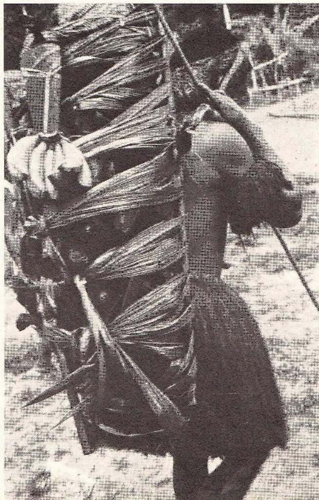
La caza es una actividad económica altamente valorizada en el plano simbólico. Aca, un hombre regresando del monte con el producto de su cacería.

De este enclave de las tierras indígenas sobre una superficie reducida, con una calidad de suelo mediocre, bien podría nacer nuevos conflictos y nuevas conquistas de territorio. Se plantea ya el problema, frente a la ley, del abandono de tierras tituladas (7). ¿Quedarán ellas indefinidamente "propiedad" de la comunidad o devendrán accesibles a otros? Toda comunidad desplazada, cualquiera que sean los motivos, ¿podrá adquirir una nueva titulación? En el caso contrario, estar fuera de sus fronteras legales revelaría delito... Esto plantea de una manera más general el problema de la titulación de tierra de grupos extremadamente dispersos en unidades locales, más o menos móviles, en las zonas de poblamiento heterogéneo (caso de los Yagua). ¿No se debería limitar la concesión permanente de tierra sólo a aquellas comunidades inscritas en zonas étnicas y geográficamente homogéneas (por ejemplo, una cuenca), autorizando una gran libertad de desplazamiento