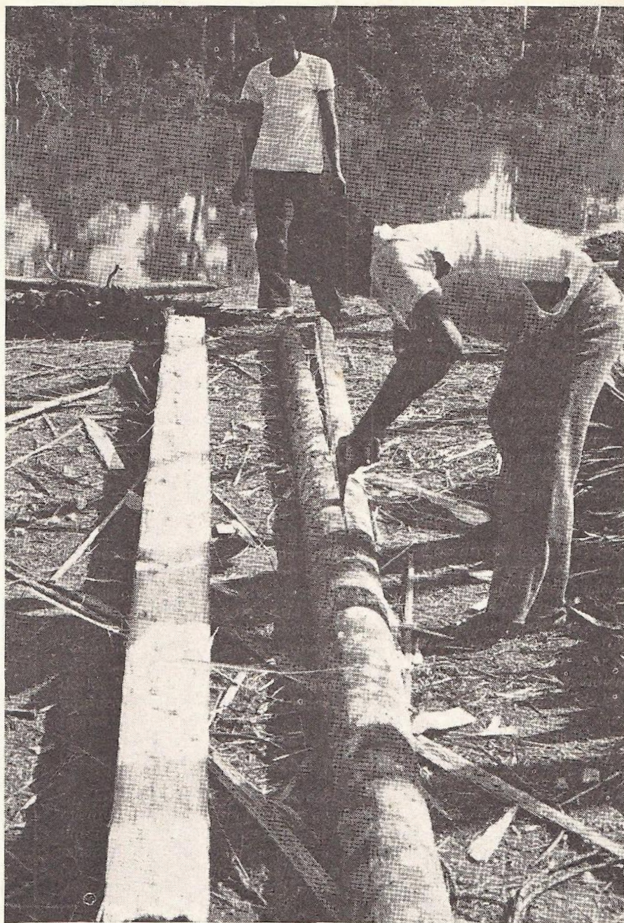
De un territorio casi infinito, con sus confines tan lejanos que no se podían jamás alcanzar, los Yagua se encuentran hoy propensos a sufrir una escasez opresiva.

En principio, es la presencia de las misiones jesuítas la que ha modificado la noción de territorio y, en consecuencia, aquella de frontera (6). Por esto, es necesario examinar los pasos y el consenso mobilizador empleado por los misioneros para concentrar a diferentes poblaciones en torno a un polo de atracción. La estructura tan característica de las reducciones jesuítas, con la satelización de los grupos en la periferia, impone una salida respecto del territorio de tutela y una permanencia efectiva. No solamente los grupos reunidos deben reconocer la necesidad de defender las tierras de protección y de de-