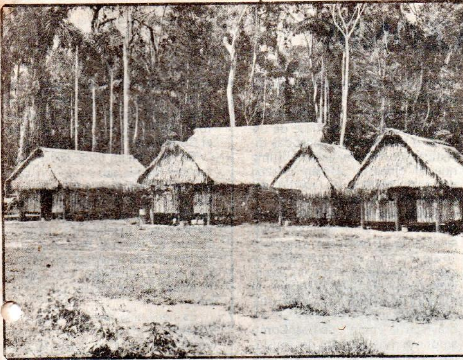
El asentamiento nativo es bastante disperso. La mayoría de los grupos se encuentran alejados de las ciudades.

carles algunos derechos más al gobierno.