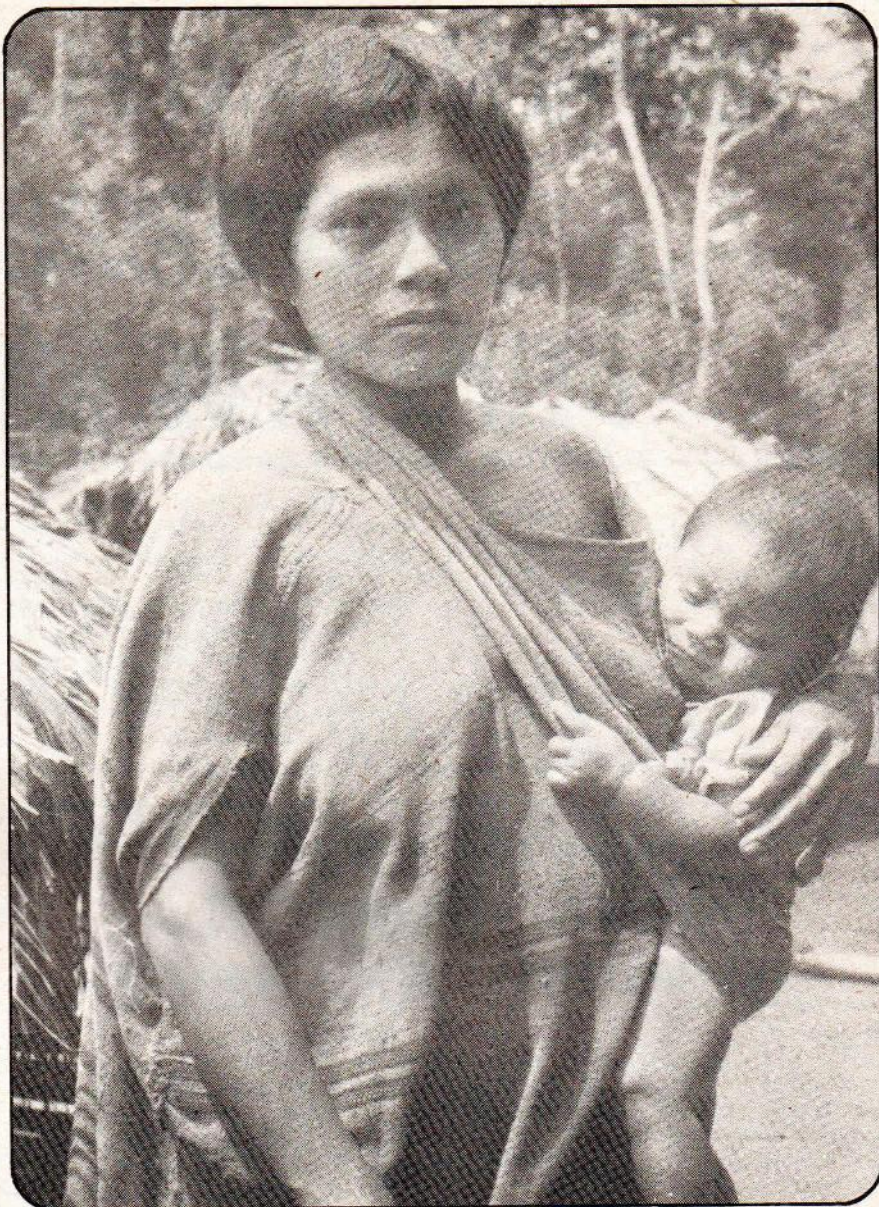
Mujer nativa machiguenga (matsigenka) de la Comunidad de Timptá. Al igual que muchas comunidades nativas de toda la selva peruana, la de esta mujer nativa también se pregunta por qué el gobierno se niega a darles los títulos de propiedad de sus tierras comunales. Ella quizás no sabe hasta ahora que hay poderosos intereses que se oponen a la titulación y que las comunidades tendrán que luchar para que respeten sus derechos.

Todo lo dicho es parte de un problema muy peligroso para las comunidades nativas. Peligro que está en la autorización del actual gobierno a empresas madereras,