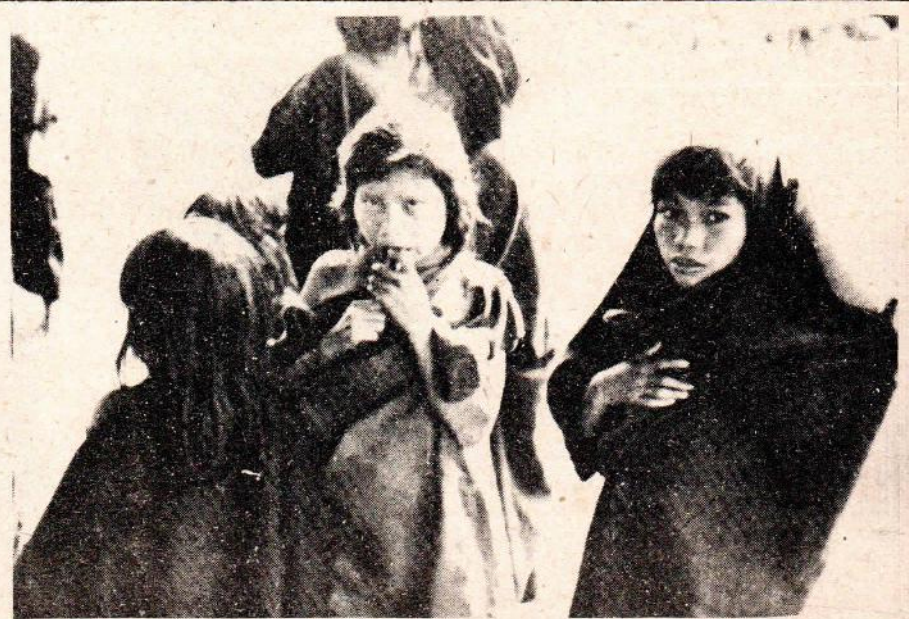
La tierra es también la esperanza de un futuro digno para estos niños Campa.

estudian y se discuten las leyes que sirven para el gobierno del país. Pues bien, allí se hizo llegar el "INFORME REFERIDO A LAS INVASIONES DE TIERRAS EN LA ZONA DEL RIO ENE" preparado por la Comisión especial que viajó a la zona. Esta Comisión estuvo conformada por